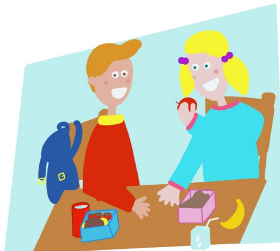
IKC De Oceaan