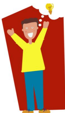
IKC De Oceaan