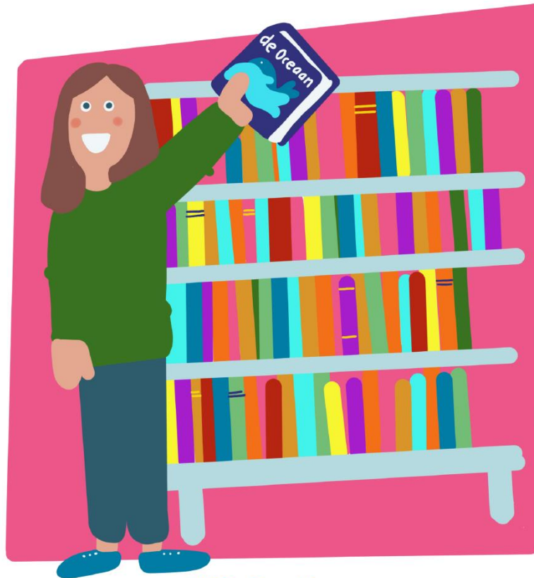
IKC De Oceaan